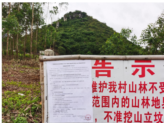
图 3.2-1 福头公示张贴

综上，项目环境影响评价第二次公示张贴方式、地点及时限均符合《环境影响评价公众参与办法》（生态环境部令 第4号）的要求。