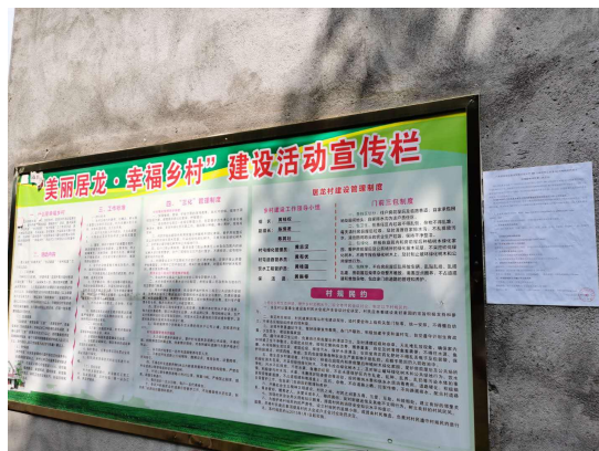
图 3.2-2 居龙公示张贴