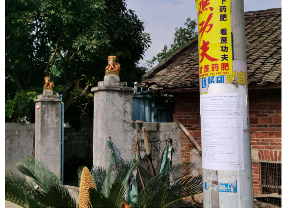
图 3.2-4 岜庙公示张贴