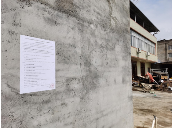
图 3.2-3 居龙公示张贴